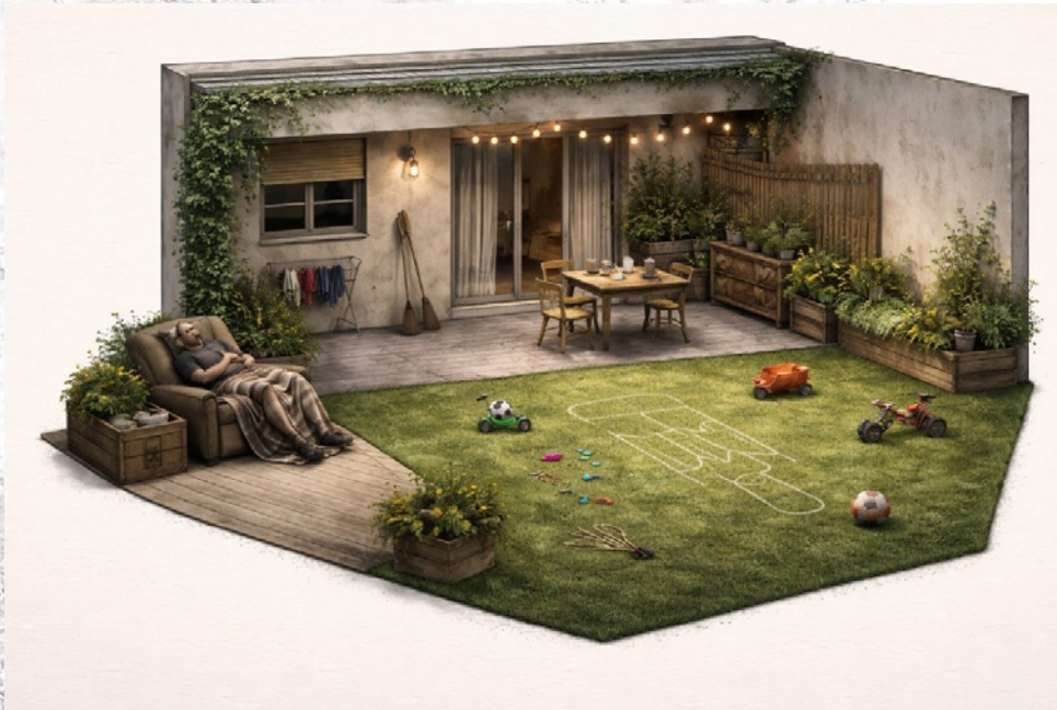
Proposta aproximada d'escenografia. Generada per IA

L'escenografia crea un espai a mig camí entre el domèstic i l'inquietant: un jardí familiar amb elements quotidians que, progressivament, es tornen estranys. La il·luminació i el so reforcen els canvis de to, des de la intimitat fins a la tensió i el surrealisme. El resultat és una proposta visual i emocional que oscil·la entre el reconeixement i el desconcert.